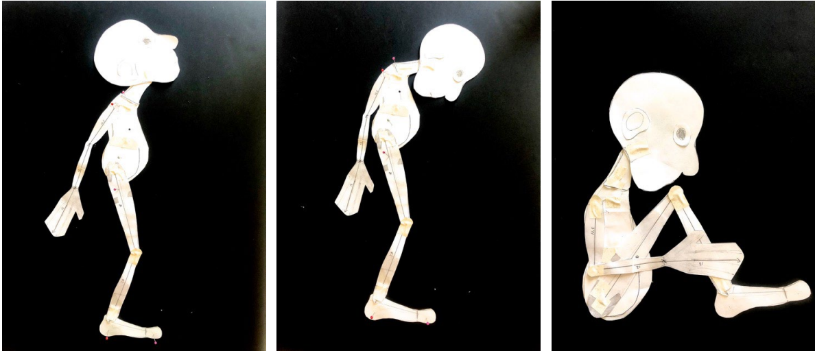
Maquette en papier du personnage

Dans ce spectacle la conception et la construction de la marionnette anticipent tout travail sur scène. Après avoir terminé la fabrication nous commencerons l'écriture de plateau avec l'équipe pour découvrir son univers.