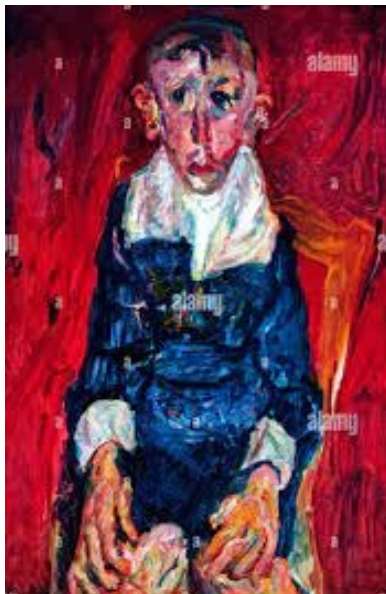
Chaim Soutine peintre impressionniste